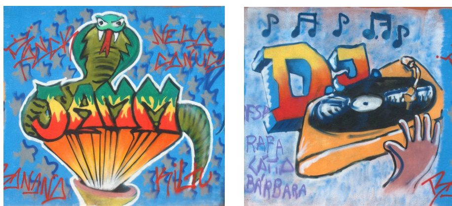
Figura 1: Parte do hall of fame da escola

Esta actividade “(...) veio desmistificar a ideia de vandalismo a que esta arte foi sujeita (...). Com este tema (explorado nas aulas) aprendemos que por trás de um “color piece” estão muitos dias de trabalho intenso, muitas latas gastas e muitos esboços elaborados (...)” “Acho que todos os grupos conseguiram atingir os objectivos propostos. A avaliação é bastante positiva.” (aluno).