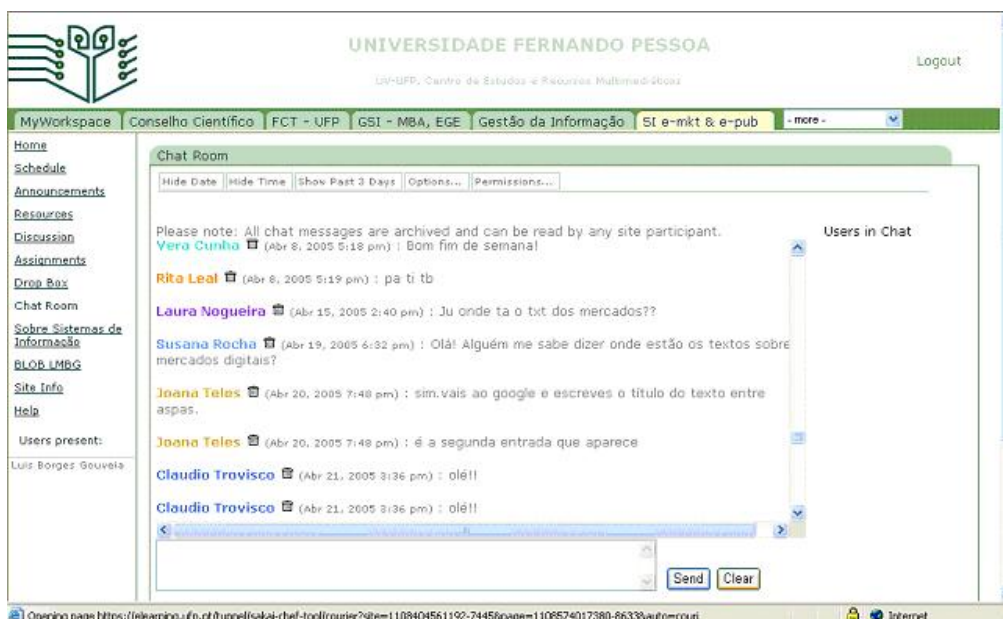
Figura 6: A ferramenta de chat integrada na plataforma UFP-UV (período experimental)

A Figura 6, apresenta um dos serviços disponíveis na plataforma, de chat , que permite a comunicação síncrona entre utilizadores com autorização ou inscrição na área em causa. O serviço de chat proposto pela plataforma Sakai, permite o registo de actividade, pelo que também pode funcionar de forma assíncrona, sendo possível consultar a sequência de mensagens desde a inicial até à última mensagem enviada. No resto, o serviço de chat é idêntico a serviços do mesmo género existentes noutros contextos.