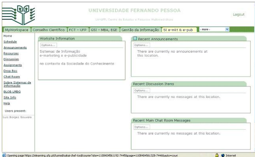
Figura 5: Aspecto da plataforma Sakai adaptada ao projecto UFP-UV (período experimental)

A Figura 6, apresenta um dos serviços disponíveis na plataforma, de chat , que permite a comunicação síncrona entre utilizadores com autorização ou inscrição na área em causa. O serviço de chat proposto pela plataforma Sakai, permite o registo de actividade, pelo que também pode funcionar de forma assíncrona, sendo possível consultar a sequência de mensagens desde a inicial até à última mensagem enviada. No resto, o serviço de chat é idêntico a serviços do mesmo género existentes noutros contextos.