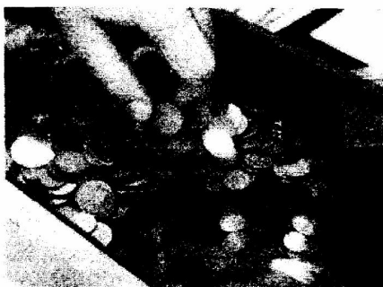
40 das 250 queixas ontem recebidas pela Deco tiveram a ver com o euro

Além de queixas dos consumidores foram, também, as instituições de crédito; algumas delegações do Totta, em Lisboa, recusaram-se a fornecer a nova moeda a não clientes,