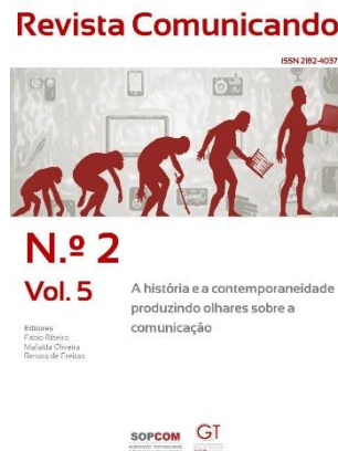
Imagem 1: Capa do Volume 5, Número 2 da Revista Comunicando

Imagens - As imagens (fotografias e outras figuras) devem estar, preferencialmente, convertidas para o formato jpg antes de serem inseridas no texto do Word (inserir-figura-do arquivo). Tal como noutras representações gráficas, as imagens devem vir acompanhadas da fonte ou dos créditos, respeitando assim os direitos de autor. Por exemplo: